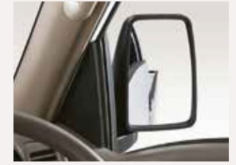
Wide view outside mirror