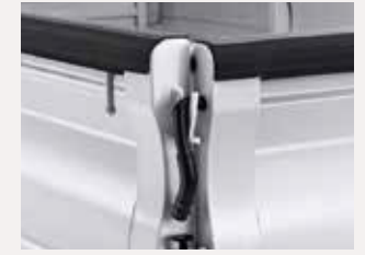
Brim cover & tailgate bolt